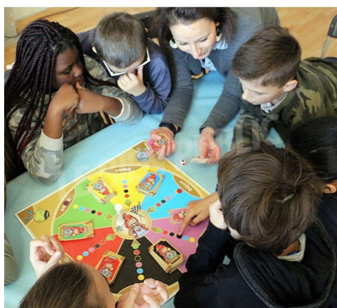
Jeux de société « Tous égaux, tous différents »