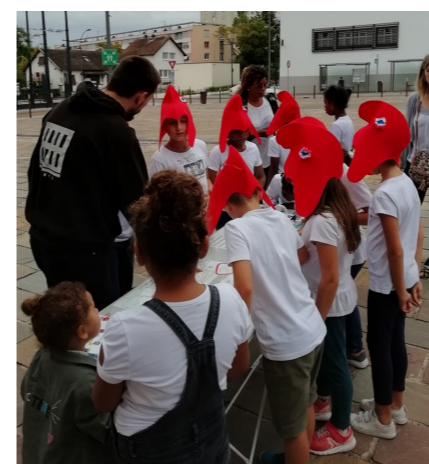
Fête de la République - stand enfants