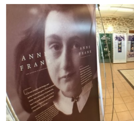
Exposition Anne Frank, une histoire d'aujourd'hui