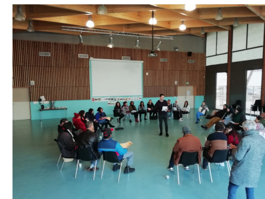
Café-parents dans un collège de Besançon