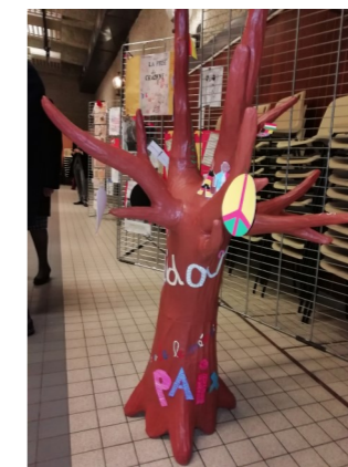
L'Arbre de Mémoire enfants de 7 à 9 ans