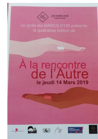
Journée au lycée Les Marcs d'Or