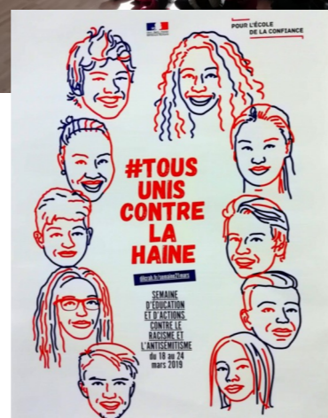
Semaine de lutte contre le racisme