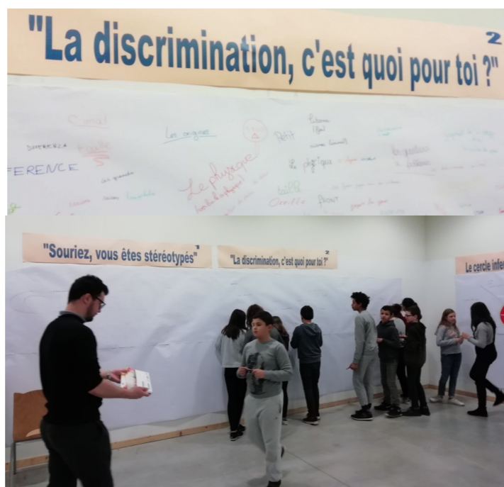
Collège Edouard Herriot Chenove