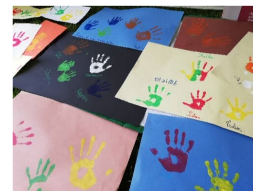
« Jouons de nos différences »