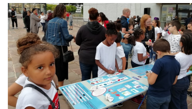
Tables citoyennes pour enfants, adolescents et adultes