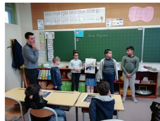
Jouons la carte de la fraternité

Chaque année, nous touchons plus de 10 000 enfants, jeunes, visiteurs par nos actions