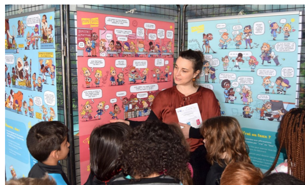
Exposition « Egalité parlons-en ! »